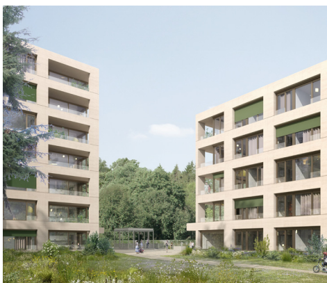
Rendu 3D du projet

Le bureau ass architectes associés sa est mandaté en tant que direction des travaux, pour le suivi de la réalisation des ouvrages situés Chemin de la Chevillarde 11 à Chêne-Bougeries.