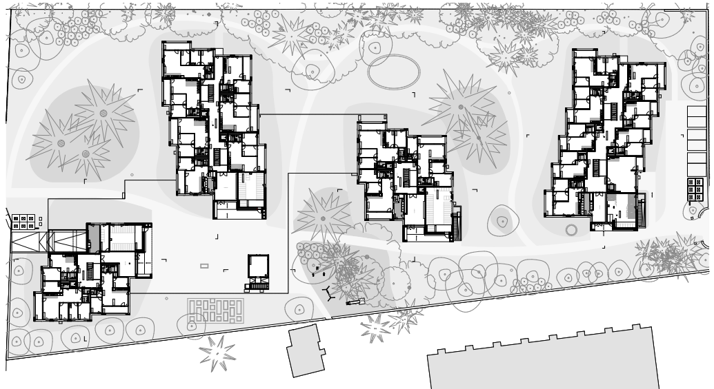
Plan général de situation

Direction et suivi des travaux pour la construction d'immeubles de logement en collaboration avec le bureau BCMA Architectes.