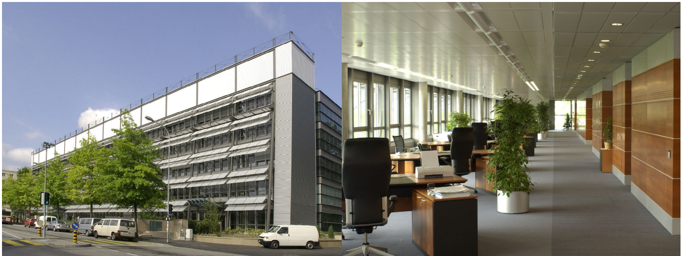
Vue de la façade