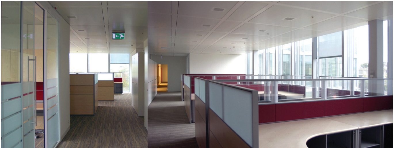
Vues de l'aménagement

Lieu Programme Lancy, GE Centre administratif moderne, comprenant des bureaux paysagers et individuels, des salles de conférence, un centre informatique, une réception/atrium, une cuisine professionnelle, un restaurant d'entreprise, des groupes de secours, ainsi que des installations techniques impliquant les dernières technologies et un garage souterrain. Maître d'ouvrage Capital International sa