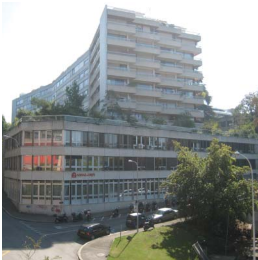
Vue du bâtiment depuis le chemin Thury