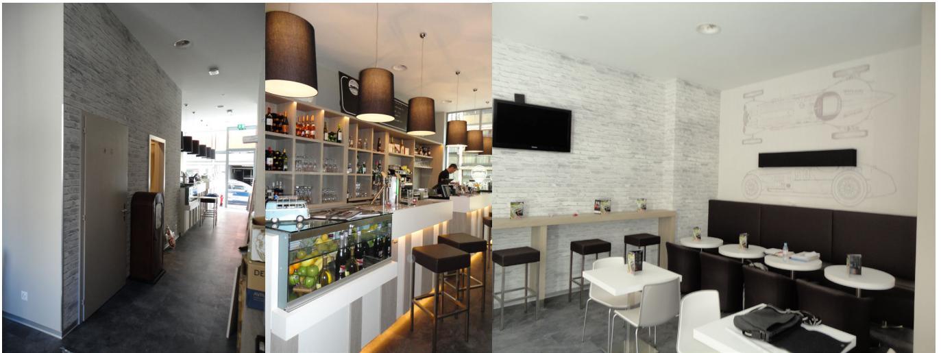
Vues intérieures des aménagements

Lieu Eaux-Vives, GE Programme Transformation d'un ancien garage en bar, rue Henri Blanvalet 23, rez-de-chaussée, à Genève. Maître d'ouvrage - Problématique La transformation d'une arcade abritant un garage de mécanique en bar nécessite une approche globale des problèmes techniques résultant de l'utilisation finale des locaux. Ainsi, il a fallu analyser les risques inhérents à l'occupation ancienne des lieux (pollution), puis mettre en place le concept technique apte à satisfaire un bar accueillant du public. Pour ce faire, il a fallu analyser les différentes possibilités d'aménagement et d'intégration des nouvelles installations techniques et de sécurité pour concevoir un bar offrant tout le confort attendu. Un soin particulier fut apporté, en accord avec le concept et le design retenu, aux aménagements afin d'apporter le confort climatique et acoustique et lumineux dans cet ancien hangar.