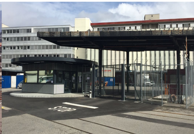
Sécurisation du site Nord - Vue de la guérite et portail de contrôle