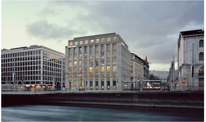
Vue depuis le quai de l'île