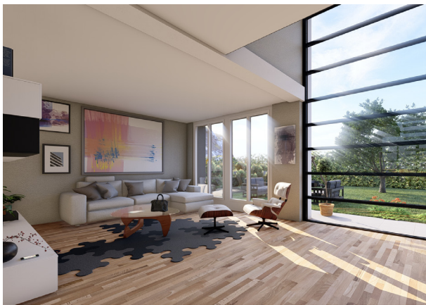
Visualisation de l'intérieur

Construction de 2 villas jumelle, à Troinex - Genève