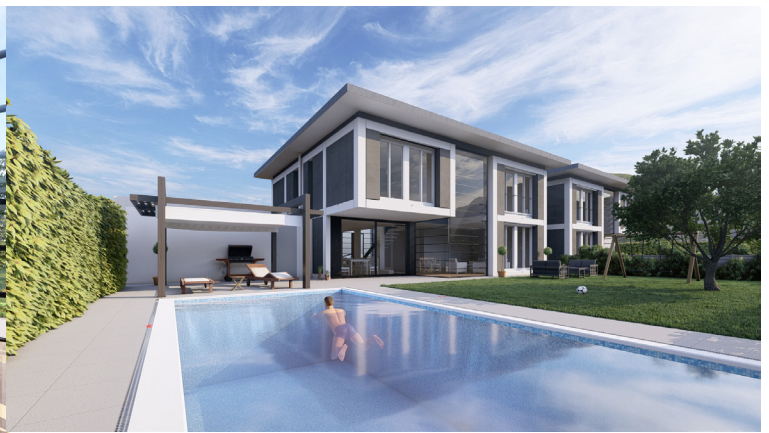
Façades coté jardin