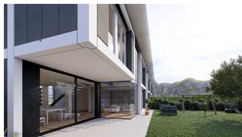
Visualisation des jardins privés